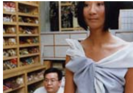
O: Das Musselinekleid mit einer Knotendrapierung und dasselbe Kleid als Rock Draped muslin dress which is adjusted with knots and the same dress as a skirt